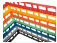
optie- bovenrand- clixrack-600