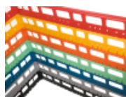
optie- bovenrand- clixrack-600